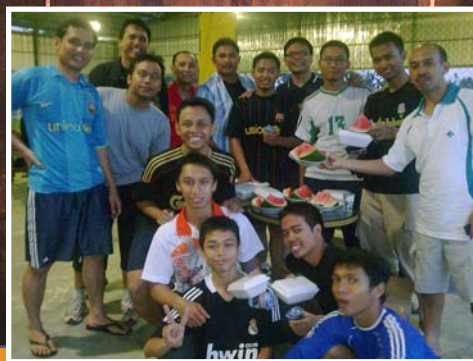
Setelah mengadakan latihan rutin, Tim Futsal BPK RI Perwakilan Provsu menggelar buka puasa bersama di lapangan futsal Village dalam rangka mempererat tali silaturahmi antar pemain.