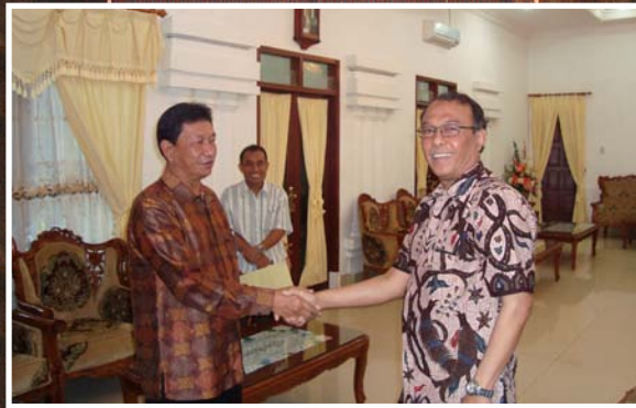
Kalan BPK RI Provsu bertemu dengan Bupati Tapanuli Utara di rumah jabatan Bupati Tapanuli Utara dalam rangka menjalankan tugas sebagai Penanggung Jawab Tim Pemeriksaan Jamkesmas.