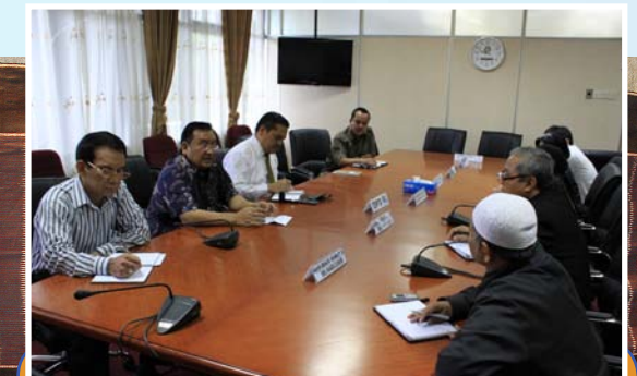
23 Juni 2010 BPK RI Perwakilan Provinsi Sumatera Utara menerima kunjungan kerja dari Dewan Perwakilan Daerah Republik Indonesia (DPD RI)

Sumber : Daftar Cakupan Entitas yang Diperiksa, data Sekretariat Kepala Perwakilan