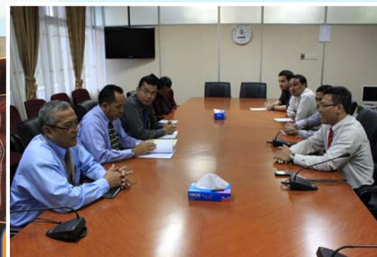
14 Juni 2010 BPK RI Perwakilan Provinsi Sumatera Utara menerima kunjungan kerja dari Komisi Pemberantasan Korupsi (KPK)