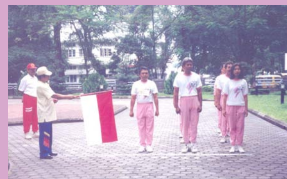
Juli 1995 Para pegawai BPK Perwakilan I di Medan sedang mengikuti kegiatan gerak jalan dalam rangkaian Pekan Olah Raga Pegawai BPK RI