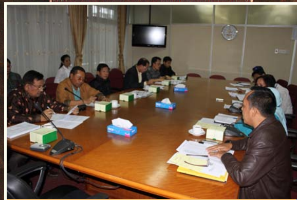
BPK RI Perwakilan Provsu mengadakan pertemuan dengan Dewan Perwakilan Daerah Republik Indonesia (DPD-RI) dalam rangka kunjungan kerja.