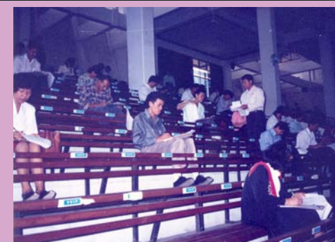
Oktober 1996 Tes Penyaringan Penerimaan Calon Pegawai Badan Pemeriksa Keuangan untuk S1 Akuntansi