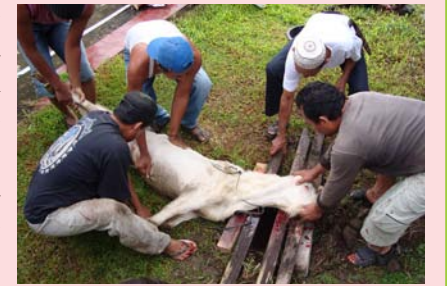
FOTO TEMPOE DOELOE