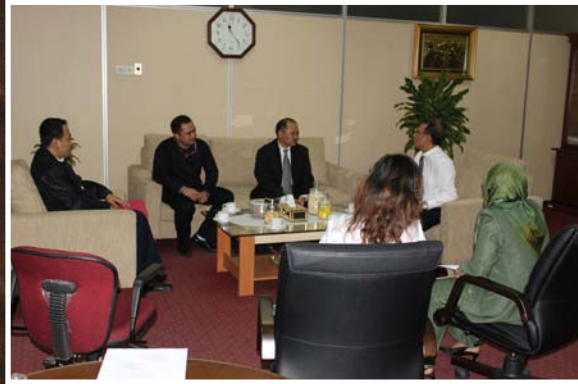
Kepala Perwakilan BPK RI Perwakilan Provsu bersama para pejabat struktural menerima kunjungan Komisi Pemberantasan Korupsi (KPK)