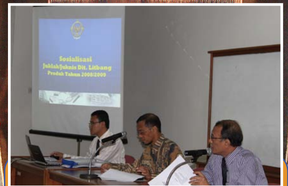
Kepala Perwakilan BPK RI Provsu membuka acara Sosialisasi Juklak/Juknis Dit. Litbang Produk Tahun 2008/2009 di ruang Balai Diklat Medan