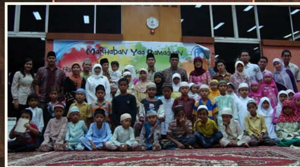
Kalan BPK RI Provsu beserta pegawai BPK RI Provsu berfoto bersama para anak yatim setelah mengadakan acara buka bersama dan pemberian santunan