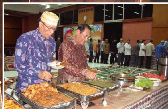
Tortama KN V dan Kalan BPK RI Provsu serta para pegawai menikmati hidangan berbuka puasa pada acara buka puasa bersama seluruh karyawan-karyawati di lingkungan kerja BPK RI Provsu