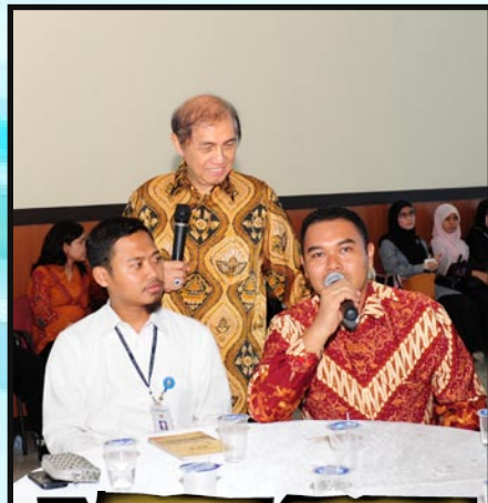
Ketua BPK RI berdiskusi interaktif dengan para pegawai BPK Perwakilan Provinsi Sumatera Utara