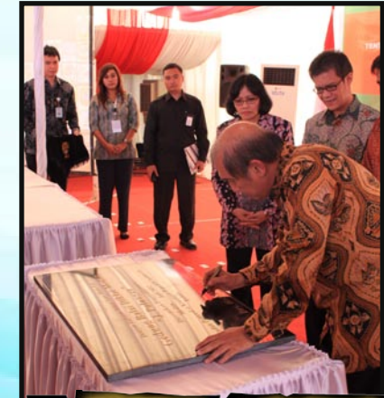
Ketua BPK RI menandatangani prasasti peresmian Balai Diklat Medan