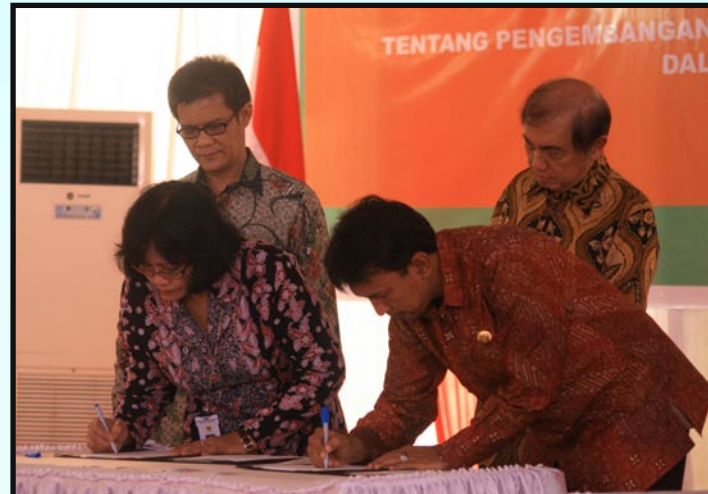
Ketua BPK RI menyaksikan penandatanganan Nota Kesepahaman