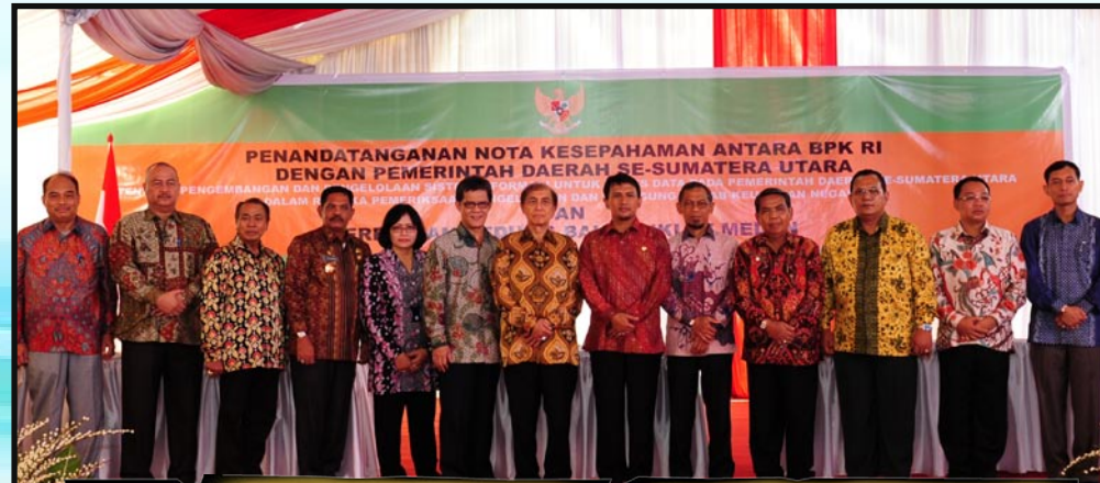
Ketua BPK RI beserta pejabat dari BPK RI bersama dengan para Kepala Daerah setelah penandatanganan Nota Kesepahaman