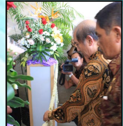
Ketua BPK RI menggunting pita peresmian Balai Diklat Medan