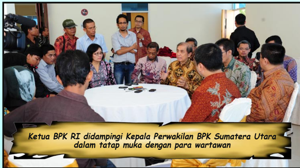
Ketua BPK RI didampingi Kepala Perwakilan BPK Sumatera Utara dalam tatap muka dengan para wartawan