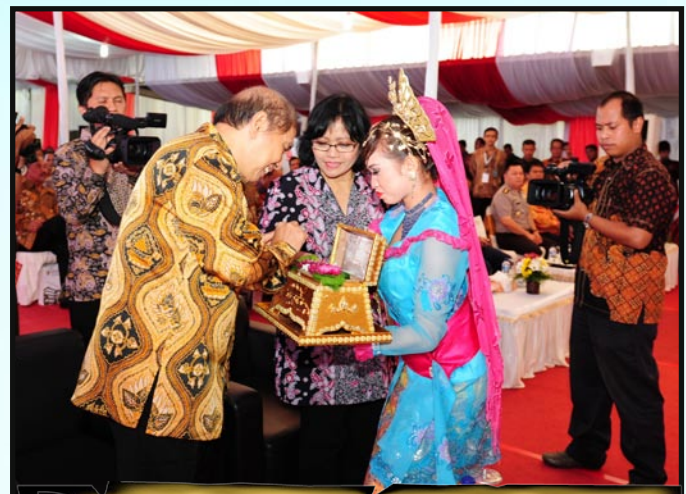
Ketua BPK RI menerima sirih dari penari sebagai tanda ucapan selamat datang