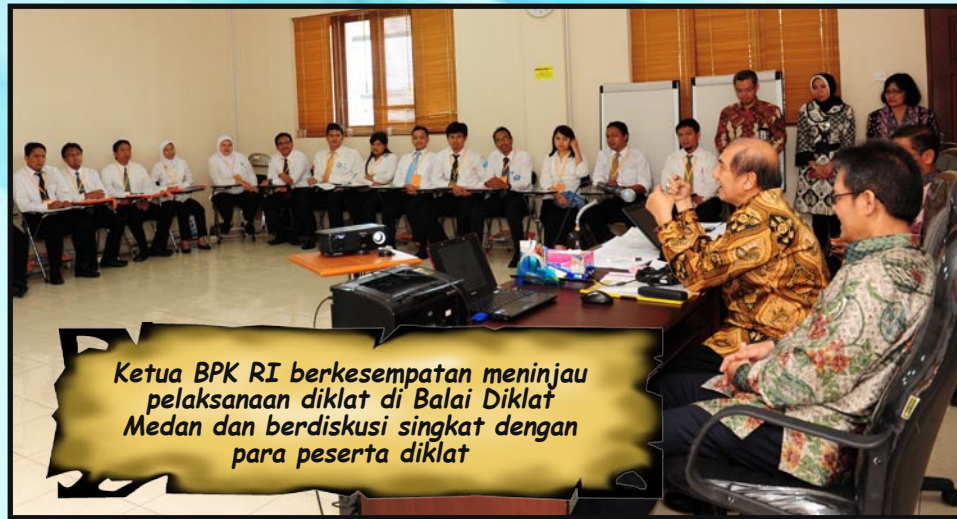
Ketua BPK RI berkesempatan meninjau pelaksanaan diklat di Balai Diklat Medan dan berdiskusi singkat dengan para peserta diklat