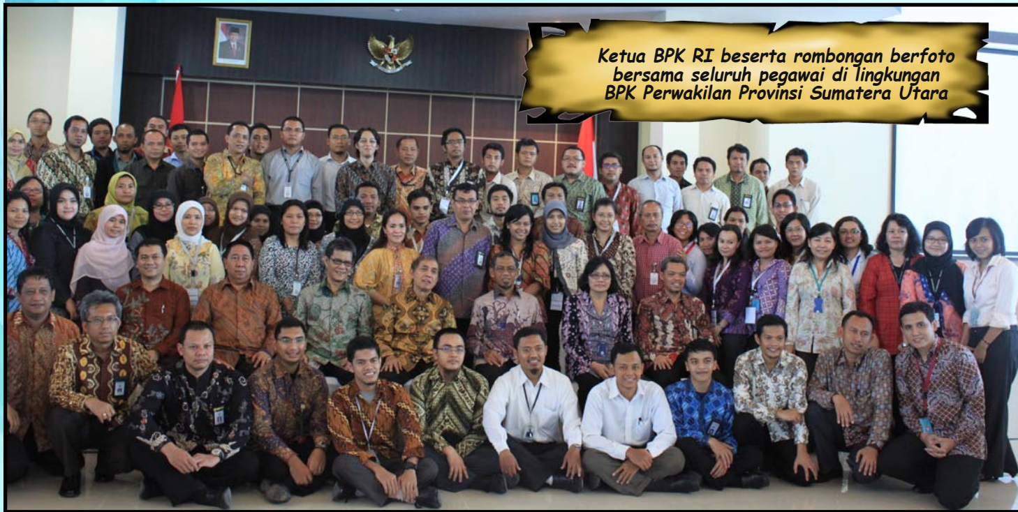
Ketua BPK RI beserta rombongan berfoto bersama seluruh pegawai di lingkungan BPK Perwakilan Provinsi Sumatera Utara