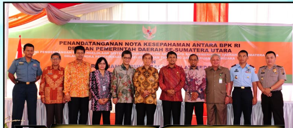
Ketua BPK RI beserta pejabat dari BPK RI bersama dengan para undangan dari Forum Komunikasi Pimpinan Daerah Provinsi Sumatera Utara