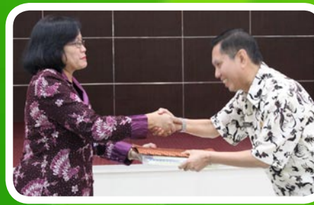
30 Maret 2012 Pekab Deli Serdang