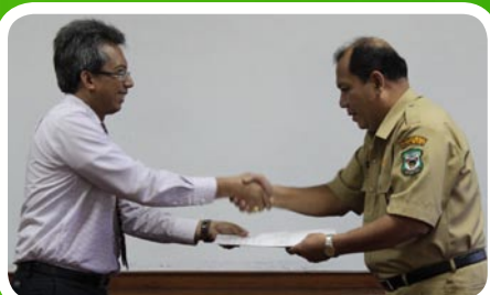
22 Maret 2012 Pemko Pematang Siantar