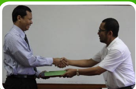
20 Maret 2012 Pekab Mandailing Natal