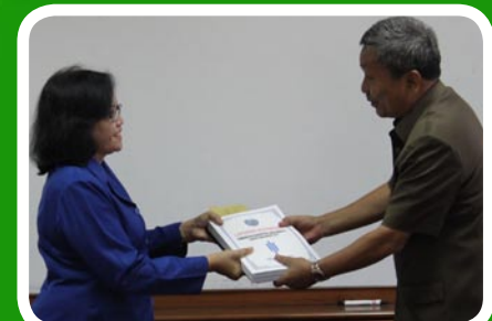
19 Maret 2012 Pekab Labuhanbatu