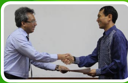
21 Maret 2012 Pekab Simalungun