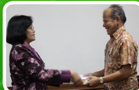
30 Maret 2012 Pekab Labuhanbatu Selatan

foto-foto oleh: 1. Suhendri 2. Irfan Mangkunegara