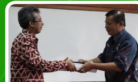
30 Maret 2012 Pemko Binjai