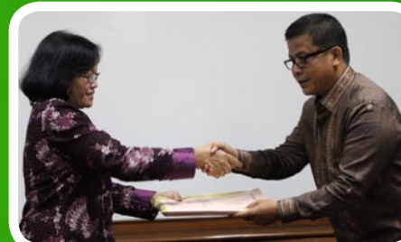
30 Maret 2012 Pemko Padangsidimpuan