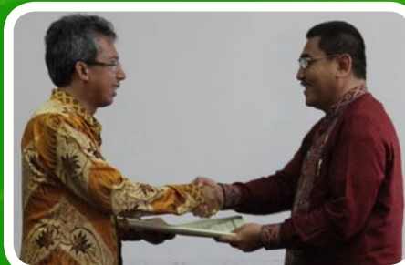
16 Maret 2012 Pekab Serdang Bedagai