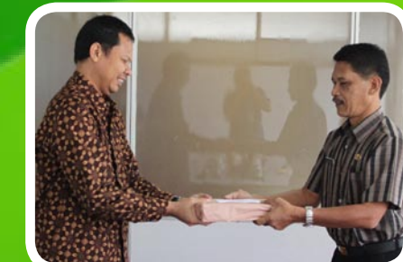
30 Maret 2012 Pekab Tapanuli Tengah