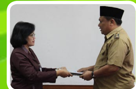
29 Maret 2012 Pemko Tanjung Balai