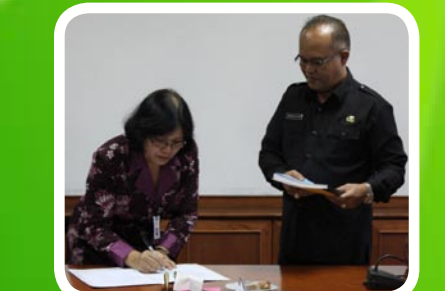
30 Maret 2012 Pekab Dairi