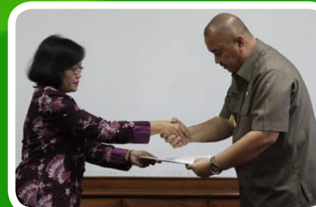
30 Maret 2012 Pekab Langkat