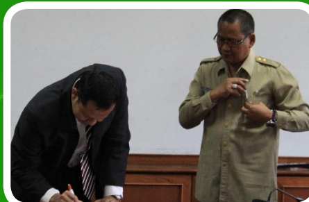
15 Maret 2012 Pekab Tapanuli Utara