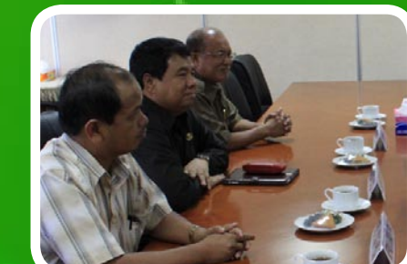
30 Maret 2012 Pekab Karo