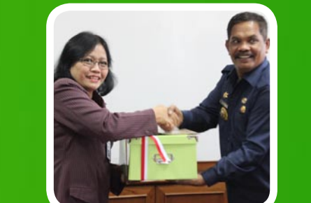
20 Maret 2012 Pemko Medan