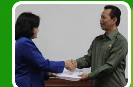
19 Maret 2012 Pekab Tapanuli Selatan