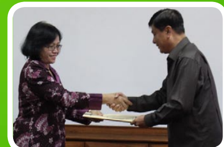
30 Maret 2012 Pekab Batubara