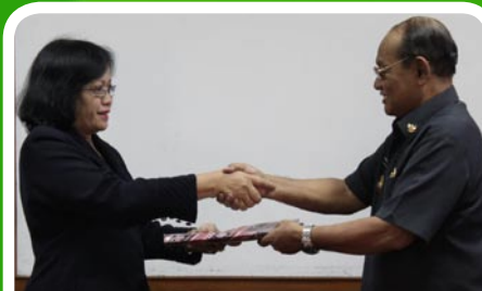
27 Maret 2012 Pekab Labuhanbatu Utara