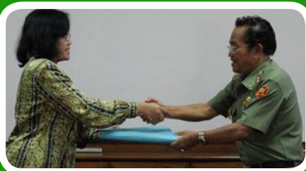
12 Maret 2012 Pekab Pakpak Bharat