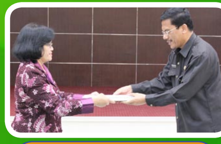
30 Maret 2012 Pekab Toba Samosir