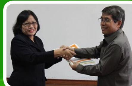
27 Maret 2012 Pemprow Sumatera Utara