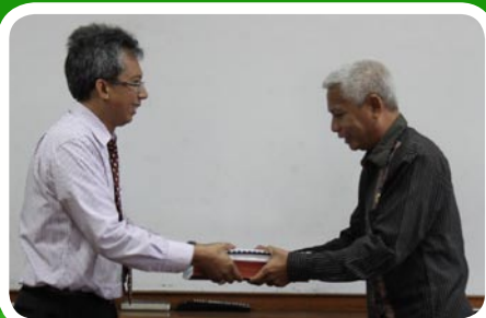
14 Maret 2012 Pekab Asahan