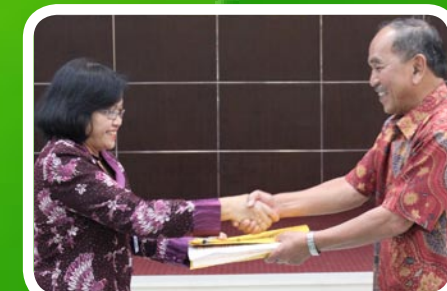
30 Maret 2012 Pekab Humbang Hasundutan