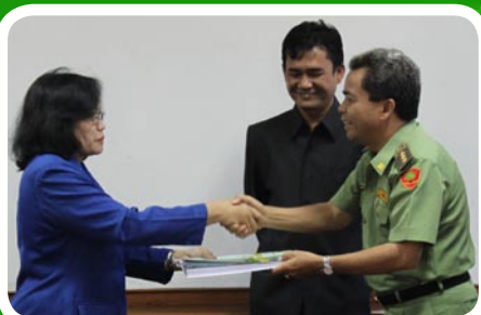
19 Maret 2012 Pekab Samosir